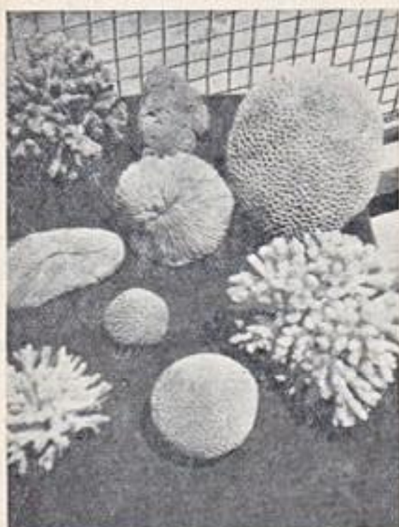
פנה בתערוכה: אלמוגים

"בית התרבות" העירוני ברחוב הירקון בתל-אביב שמש החודש אכסניה נאה לתערוכה של קונכיות, אלמוגים וחלזונות-יים מחופי ים התיכון, מפרץ עקבה, חופי הים האדום והאוקיאנוס ההודי, המוצגים נאספו והובאו לשם מ"מוזיאון הארץ" וממספר אוספים פרטיים, המוצגים הרבים שהוצגו נותנים לנו מושג על החיים