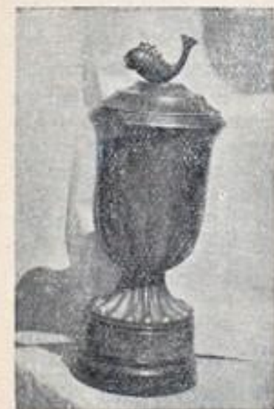
גביע החבל הימי לישראל לאלופי השחיה

החבל הימי לישראל עשה רבות להקניית ערכי ים לישוב, לחנוך הנוער לעבודת הים, להקמת מפעלי ים חשובים וחיוניים. עם החלטת הקונגרס הציוני הכ"ב האחרון המכיר בחבל הימי לישראל כבמוסד צבורי עליון לעניני הימאות העברית, הוטלו