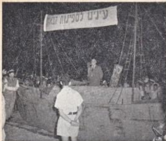
במסגד "יום הים" בת"א : נאום דוד רמז

מכל הארגונים ונושאי משותפים. נשאו טרנספרנטים רבים ודגלים. במקום המסגד — תבנית גדולה של אחת מספינות המעפילים, נר תמיד, אורות צבעוניים לאורך הסיילת, טרנספרנטים, דגלי הלאום ודגלי קוד. נאם דוד רמז, יו"ר הנהלת הועד הלאומי. את המתפקדים קבלו היה ש. סולקובסקי, כיכ מאירוביץ, מ. פיש"ש ון ור. רמז. בוצעה מסכת "יום הים" והוצג סרט ימי. על שפת הים נגנה גם תזמורת בית הספר מכס פיין.