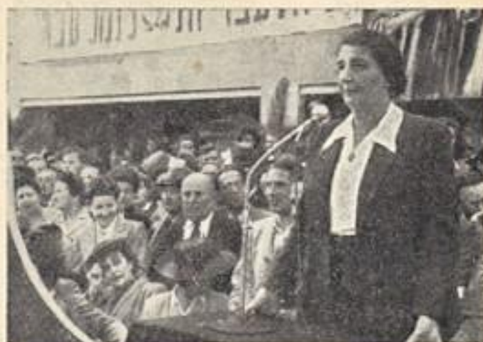
גולדה מאיר ס"ן במספר "יום הים" בחיפה