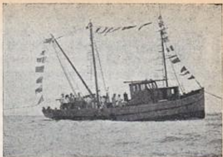
ספינת הדיג "כריש" של המושב "מכמורת"