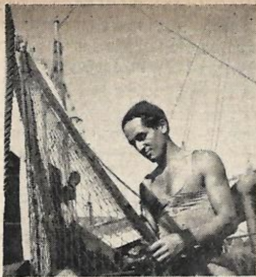
תקון רשתות לאחר הדיג

(ד"ר י. יפה) הגיע לידי תוצאות חיוביות במחקרו בצמחי הים שלנו ביחס למציאת יוד. מן הראוי לעיין בבעיה זו מנקודת ראות האפשרויות לתעשייה.