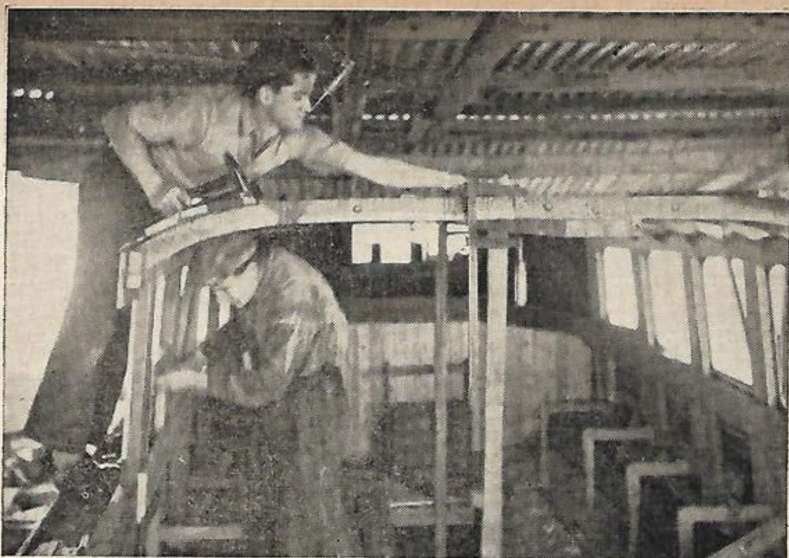
במספנה. סירה בבנינה.

בין דגי החופים במפרץ-אילת רב מאד גם דג הקיפון (בורי Mugil sp. ) בשוק-הדגים הארצישראלי הוא השני במספרו אחרי הטריה. גופו גלילי ומאריך, צבעו אפור-כהה מלמעלה ולבן-בהיר מתחת. הוא משוטט במים רדודים ומצוי בקרקע של טין ובוק. בשרו טעים מאד, אך מחמת החומר האורגני, שהוא מתפרנס בו ומעכלו מתוך הרקק, ריח של טין נודף ממנו לפעמים. בין ששת המינים, השכיחים בחופיה המערביים של ארצנו, מצוי גם הקיפון גדל-הראש (בורי פבאן Mugil cephalus ), שהוא אחד הדגים של ים-סוף, שנדדו, לאחר פתיחת תעלת-סואץ, לים התיכון, והוא מצוי ודאי גם במפרץ-אילת. הקיפון הוא הדג המצוי ביותר בראש המפרץ, וקרוב לוודאי שגם כאן יש לו מינים שונים. עם דגי החוף במפרץ-אילת נמנה גם דג משה רבנו, או הסנדל (סמך-מוסא Solea solea, S. impar ), הוא הדג השטוח והאסימטרי, העושה רושם כאילו אין הוא, כביכול, אלא "חציו של דג" המוסיף לחיות במים. לא לחנם יכנהו הערבים "דג-משה" (סמך-מוסא) ולא לחנם יספרו עליו, כי בשעה שבקע משה את הים במטהו, תצה גם את הדג הזה לשנים, אלא שאֵללה ברוב רחמיו הותיר נשמה באפיהם של "חצאי הדגים" הללו והוסיף להם עין על עינם האחת. וראה זה פלא: בקטנותו אין הוא הסנדל שונה משאר דגים: הוא סימטרי ועיניו קבועות לו משני עברי ראשו, אך משגדל יווצו עצמות הראש ועצמות חלק מן הגוף, והעין השמאלית תדוד כלפי מעלה, עד עברה אל הצד השני. הצד שנתפנה מן העין ומן העצמות, נוטה כלפי מטה, ועליו ישען הדג