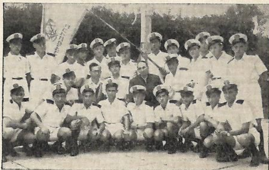
קבוץ "כובשי הים" בפאנא (איטליה). בטקס חנוכת ביתו החדש של הקבוץ.

זה שנים מספר מתנהלת פעולת הדרכה, בשיט ובמפר"שים, בקרב תלמידי הכתות הגבוהות של בתי-הספר העמ"מיים. בשנה שעברה הקיפה פעולה זו כ-300 חניך. ההדרכה המקצועית נתנה לפי התכנית לדרגא ג', הכוללת: חתירה, עבודות חבלים, מבנה הסירה, עגנים וכו'. נוסף על כך בוצעו פעולות חנוכיות-למודיות: הרצאות על נושאים ימיים, טיור לים, בקורים בנמל ובספינות וכיו"ב. בסיומה של השנה התקיימו מחנות-קיץ אחדים, לסיכום הידיעות ולהשלמתן. רבה היא הברכה הצפונה בפעולה זו. מגמתנו בה היא: לחזור לשכבות השונות של הדור הצעיר-הלומד, ולהחדיר