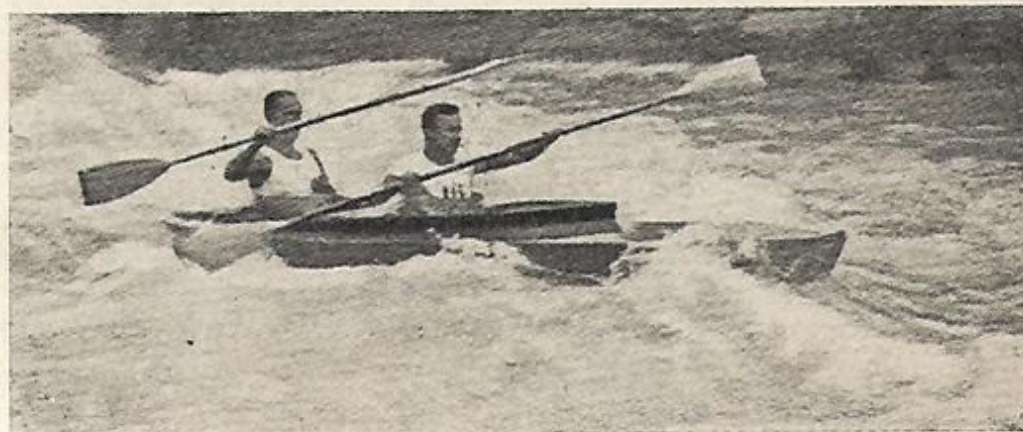
הקאיאק לשני חותרים בתוך זרם של נחל הררי.

לפני ארבעים שנה ויותר הייתי מפיץ, כילד בין ילדים, את בולי הקרן הקיימת לישראל. התענינתי כמובן גם בסכום הכולל של ההכנסות השנתיות, אבל כאז כן גם כיום אני נהנה בעיקר מ"השורה האחרונה" של הסיכום: כך וכך דונמים נרכשו במשך השנה ונוספו לקנין עולם של האומה. מתוך אותה נקודת ראות אני קובע את יחסי החי"ל. אין זה מספיק אם יגדל מספר הסניפים של החי"ל בעולם. לא די שההכנסות תרבינה וכסף רב יושקע בפעולת התעמולה וההדרכה. כל זה חשוב ללא ספק ונחוץ מאד, אבל בהערכת החי"ל נתחשב אך בדבר אחד ויחיד: גידול הטונז' העברי וריבוי העברים המתפרנסים מהים ועל ידי הים. ומזר הדבר, שלאחר יסודו של החי"ל — זה המוסד העממי שנועד למלא את התפקיד של הקרן הקיימת לימאות העברית, נשכחה ונעלמה מהאופק מטרתו העיקרית. החי"ל אבד את הפרס-פקטיבה הנכונה והפך למוסד של אוסף תרומות לצרכי הדרכה והכשרה בלבד. את התפקיד החשוב של פיתוח הספנות נטלה על עצמה מחלקת הים. והלא ביסוד פעולתנו הונח הרעיון של מאמץ קולקטיבי צבורי-לאומי בכיבוש הים, כפי שזה היה נהוג ברכישת קרקעות ע"י הקרן הקיימת לישראל. העברת הסמכות בשיח הפעולה המעשית למחלקת הים — פירושה: הוצאת הקפיץ המניע מהתנועה הימית הצבורית. ויש עוד מקום לתקון המצב. הספנות העברית נתונה עוד