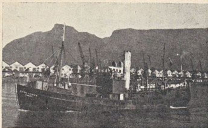
ספינת הדיג „דרום אפריקה“