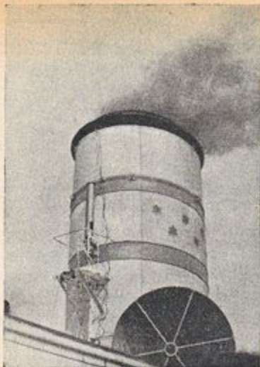
שבעה כוכבי זהב על גבי הארובה של "קומה"

להגיע לידי הסדר בדרך משפטית. אגודת הימאים טפלה איפוא בצדק בענין הסכסוך שפרץ ונהלה משא ומתן עם חברת האניות, כדי להניעה לבטל את הפטורין. ואין כאן הגנה על זכותו האישית של יורד הים העברי בלבד; זוהי תביעה ישובית כללית לשתוף פעולה מצד כל אחד ואחד בהקמת ענף משק זה או אחר, אפילו אם זה קשור בקרבות מסוימים, מועטים ביחס למפעל כולו.