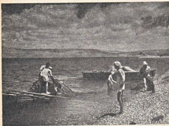
דייגי עין גב בעבודתם